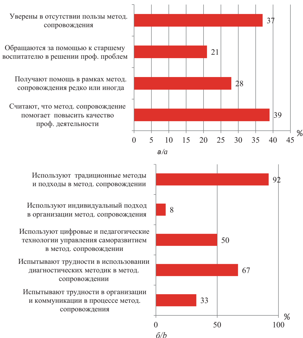
Рис. 1. Данные опроса воспитателей (а) и старших воспитателей (б) г. Череповца Fig. 1. Data from a survey of educators (a) and senior educators (b) in Cherepovets

Для подтверждения актуальности исследования был проведен опрос педагогических работников дошкольных образовательных организаций г. Череповца. В анкетировании приняли участие 248 воспитателей и 54 старших воспитателя ДОО. По данным опроса старшие воспитатели отмечают снижение мотивации в профессиональной деятельности у педагогов ДОО, нежелание обращаться за помощью и в то же время отмечают трудности в организации и неэффективность методического сопровождения с использованием традиционных методов работы. Данные опроса представлены на рис. 1.