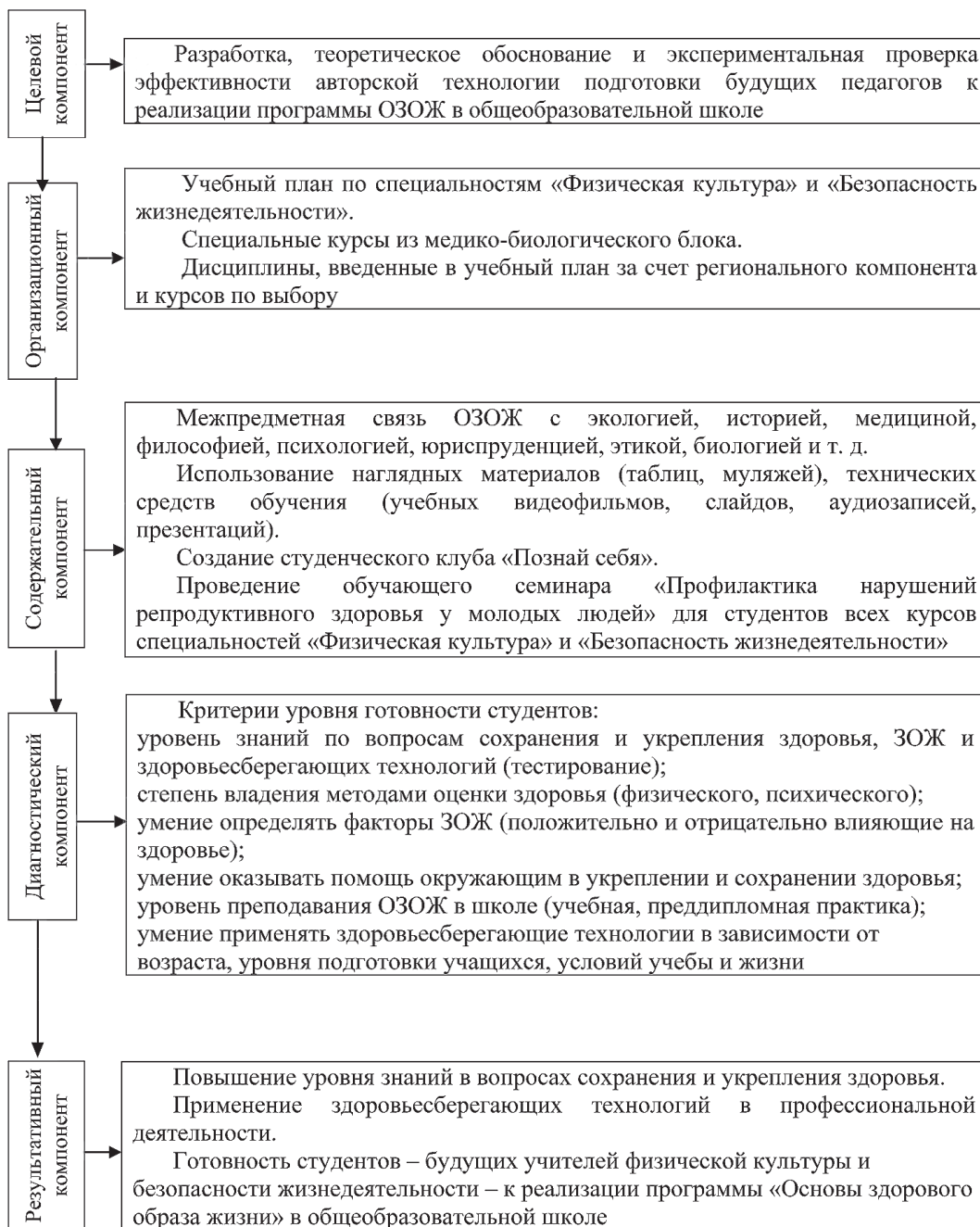
Теоретическая модель формирования готовности студентов педагогического вуза к реализации программы ОЗОЖ в общеобразовательной школе