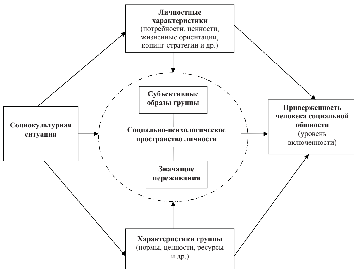
Рис. 1. Системная модель факторов приверженности человека социальной общности

ных намерений молодежи и прогнозированию их осуществления. Ограничение рассмотрения приверженности своей стране только лишь аффективными или нормативными компонентами также не способно создать целостное представление. Наиболее адекватная и полная объяснительная модель приверженности социальной общности, способная осуществлять прогностические функции, может быть построена с опорой на системный подход [11] и синтез методологии индивидуализма и социологизма в социальной психологии. В качестве основных компонентов системной модели факторов приверженности личности социальной общности могут быть выделены следующие (рис. 1).