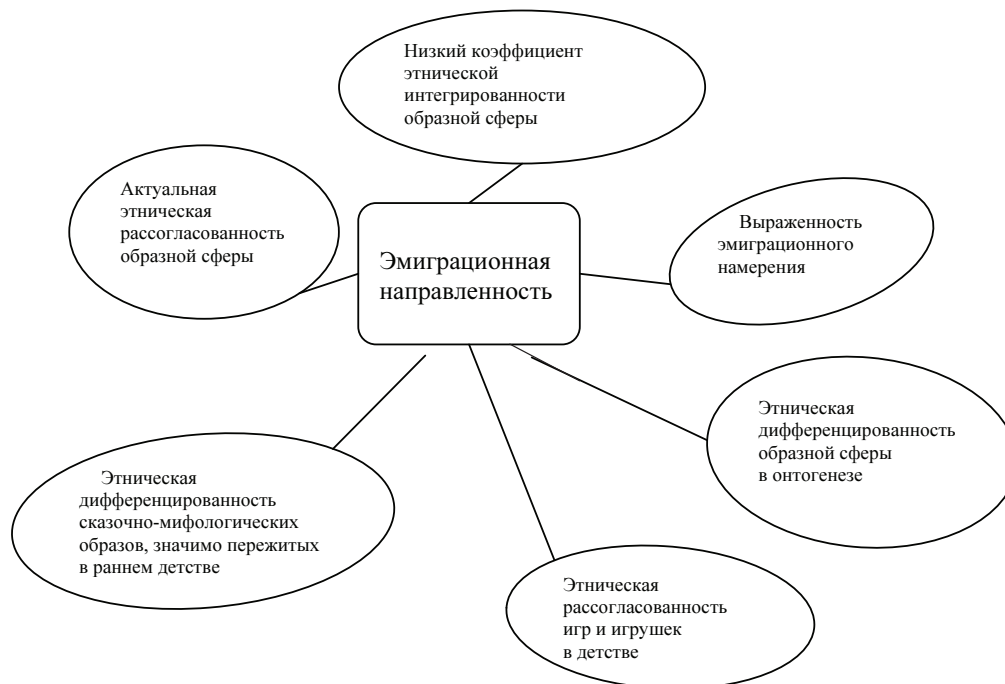
Рис. 2. Модель фактора «эмиграционная направленность»

стране в качестве первых воспринятых в детстве сказок достоверно чаще вспоминают этноинтегрирующие сказочно-мифологические образы.