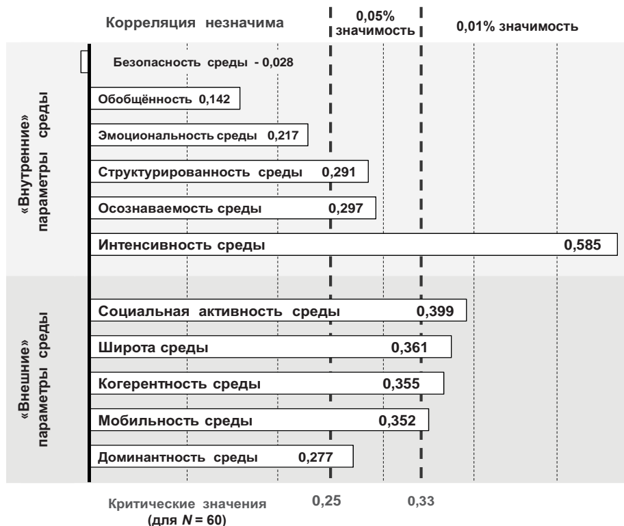
Результаты корреляционного анализа учебных достижений обучающихся с характеристиками школьной среды

Связь предметных образовательных результатов (учебных достижений) с уровнем развития школьной образовательной среды подтверждается также результатами исследования С. С. Сехина [7], который на основании анализа своих эмпирических данных, полученных с помощью той же методики экспертизы образовательной среды, пришёл к выводу, что средние показатели группы школ, входящих в ТОП 400, по каждому параметру образовательной среды выше средних показателей группы школ, не входящих в ТОП 400.